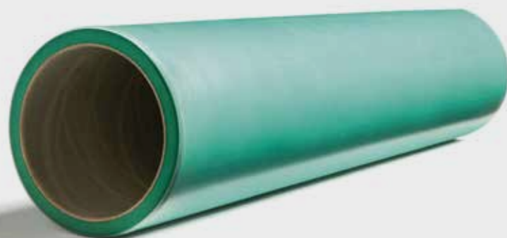
● Композитные и резиновые гильзы