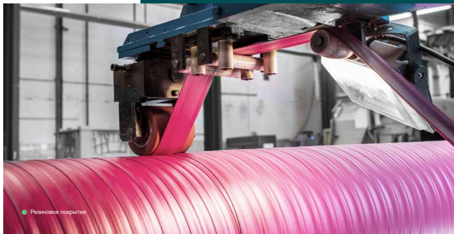
● Резиновое покрытие