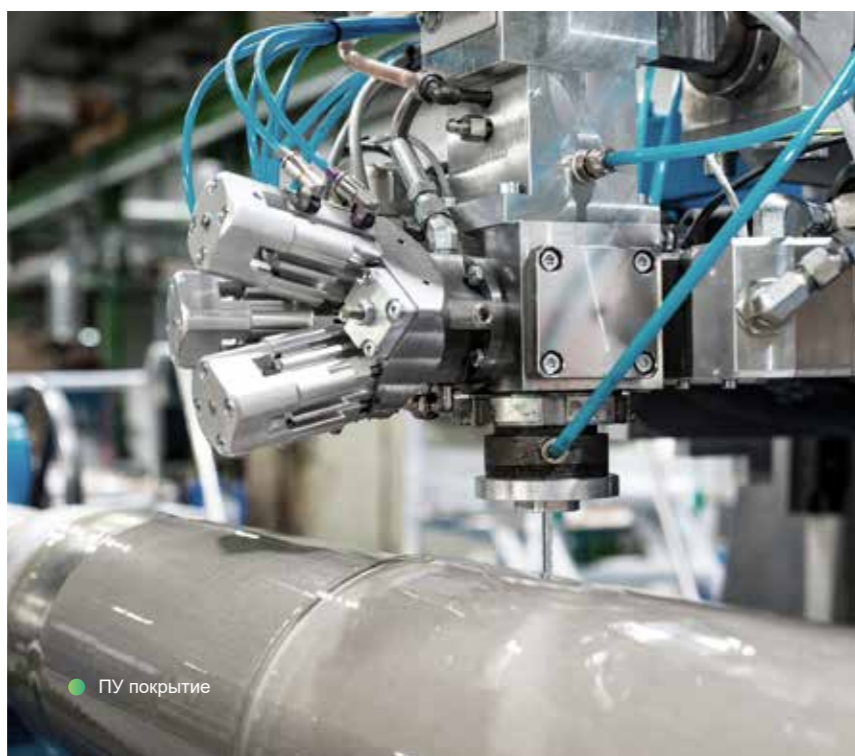
● ПУ покрытие