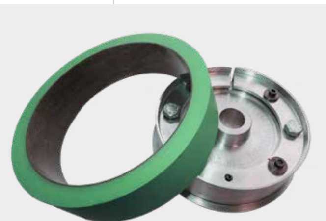
● HandySleeve® + HandyBase

Hannecard разработал технологию HandyCoat®, революционную систему нанесения покрытия на банка для напитков, чтобы удовлетворить потребности и увеличить объемы производства банок для напитков. Наша уникальная система предоставляет чрезвычайно быстрый и эффективный способ покраски алюминиевые банки для напитков, обеспечивая значительную экономию времени и средств.